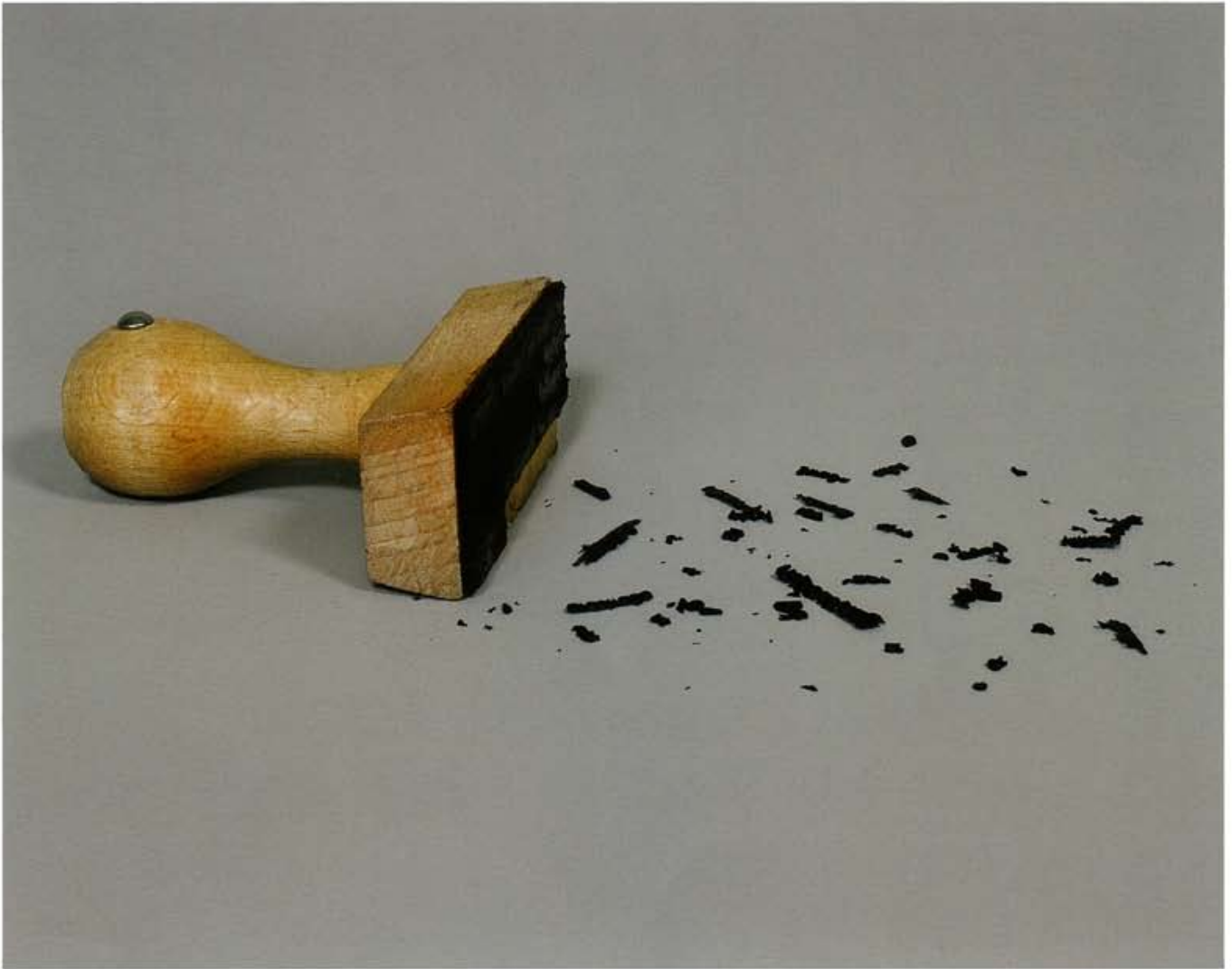
Individual Features Removed, 2003, 25 objects., dimensions and materials variable

finden sich nie in der Kinosituation, immer kann der Besucher sie umwandern, selbst eine Position vor ihnen einnehmen, sie auf andere Objekte beziehen.