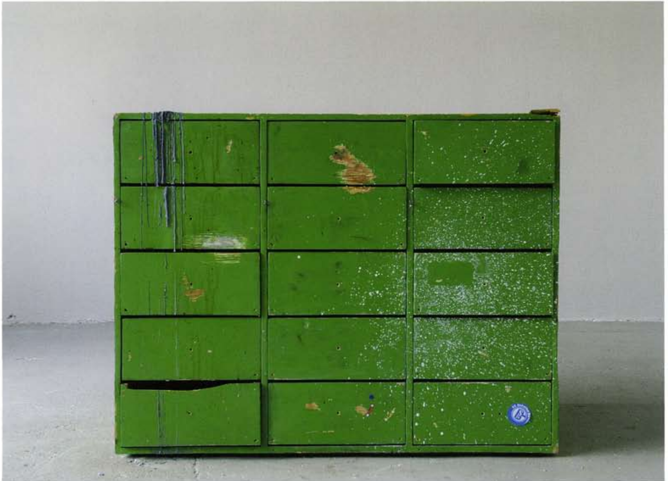
Mutual Annihilation, 2008, (Restored) Installation, Künstlerhaus Bremen