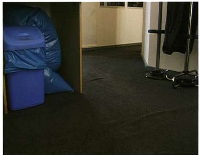
Grey Area, 12 attempts to hide in office spaces, 2001, Installation view White Collar, Berlin, DVD 9' loop, Videostills

Ein Ausgangspunkt für die Arbeit waren vorher-nachher-Bilder von Restaurierungsmaßnahmen, wobei Sofia Hultén stets erheblich mehr Sympathie für das Vorher empfindet. Indem sie nun der Restaurierung die Rekonstruktion folgen lässt und größte Energie und Mittel in die künstliche Erzeugung von Gebrauchspatina investiert, bringt sie gewöhnliche Zeitabläufe und Entwicklungslogik ins Wanken. Auf eine Rückwärtsbewegung folgt eine Vorwärts-zurück-Bewegung, um auf einen Null-Zustand zu kommen, der einen vorläufigen Endzustand beschreibt.