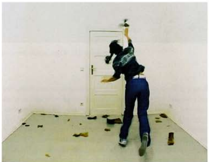
Fuck it Up and Start Again, [One guitar smashed and mended seven times], 2001, DVD 7 min., loop and guitar, Videostills