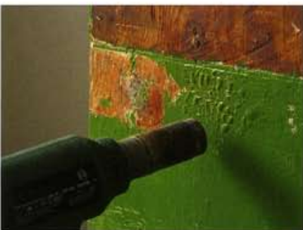
Stills aus Mutual Annihilation, 2008, DVD Video, 100 min., Künstlerhaus Bremen