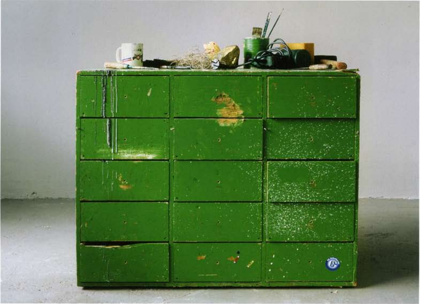
Mutual Annihilation, 2008, [Original] Installation, Künstlerhaus Bremen